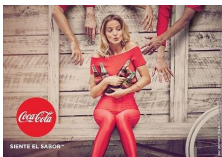
Imagen 1. Spot comercial. Siglo XX

PRÁCTICA 2. IMÁGENES PARA ANÁLISIS (a elegir una):