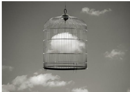
Imagen 2. Fotografía de autor. "S/T" de Chema Madoz